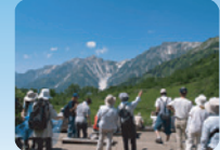
展望湿原から見る白馬三山