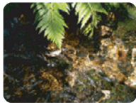
白馬大池から流れる清らかな水