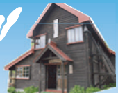
柵池ヒュッテ記念館