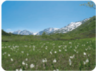
ミズバショウ湿原