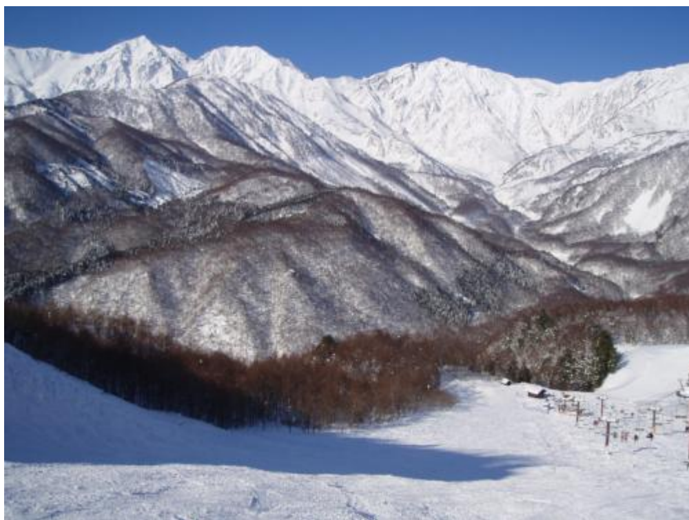
岩岳ビューゲレンデ